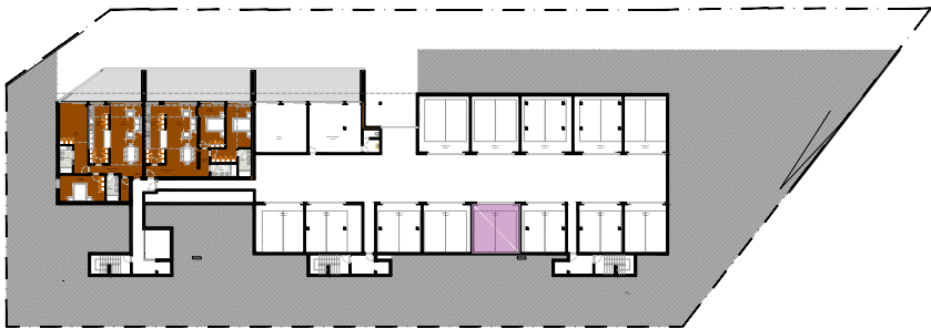
Planta Geral Piso 0