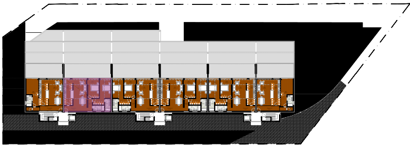
Planta Geral Piso 3

Fração P - Tipologia T2 - Piso 3 - Garagem 3 Área Bruta de Construção: 121.30 m² Área Bruta de Varanda: 52.00 m². Área de Garagem: 28.90 m² Área Total de Construção: 202.20 m²